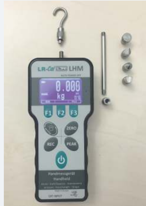
Die Abbildung zeigt auch das optionale Tool-Set mit Haken, Stößeln, usw. zur Aufnahme von Zug- und Druckbelastungen.

Zubehör: • Tool-Set mit Haken und Stößeln usw. für Zug- und Druckbelastungen • Externe Sensoren für Druck und Drehmoment • Gummischutzkappe (gelb) • ACCREDIA (DAkKS) Zertifikat für Druckbelastung